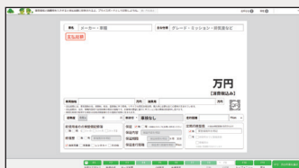
●プライスボードトップ

中古車の販売情報を入力するだけで改正内容に対応したプライスボードが簡単に印刷できます！