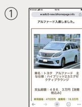
●自社ホームページ