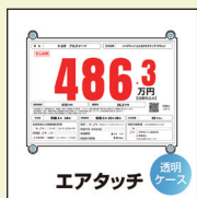
吸盤付きプライスボード 取り付けキット エアタッチ