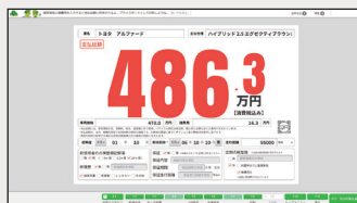
●プライスボードに入力