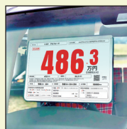
プライスボード 取り付けキット エアスカイ2